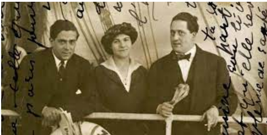
Francis Picabia, Gabrielle Buffet et Guillaume Apollinaire (1912)

Ils débordent l'un sur l'autre, le cerveau de Gabrielle apparaissant comme un réservoir de matière à étaler sur la toile. Ce qui les réunit immédiatement et les soudera à jamais, au-delà de leur future séparation, c'est le goût d'avancer vite et de jouer un rôle dans le façonnement du monde à venir.