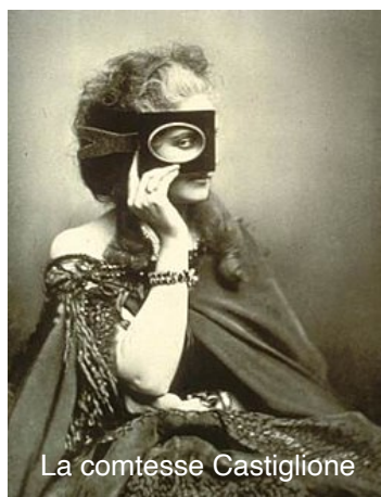
La comtesse Castiglione

Elles décèderont toutes deux dans l'oubli et la misère.